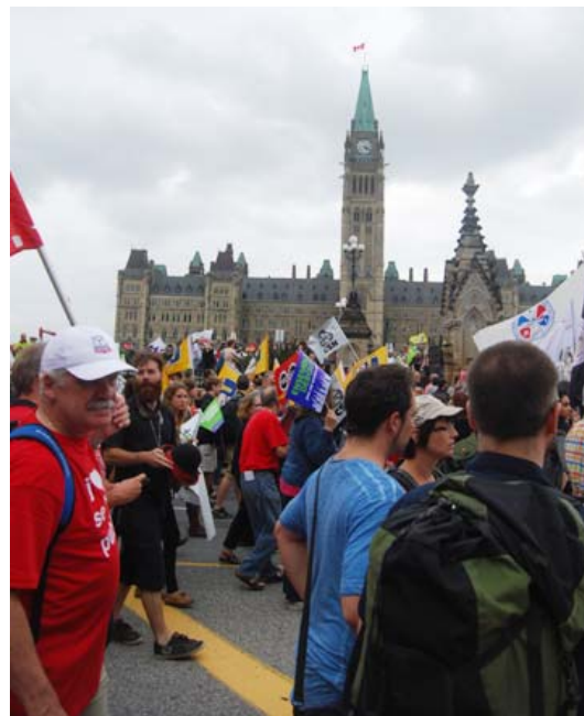
Rally on Parliament Hill, afternoon of Aug. 21

All in all, it was a wonderful gathering that reinforced my commitment to becoming a better activist for our union, our society and our planet. I look forward to the next World Social Forum coming to Montréal in 2016!