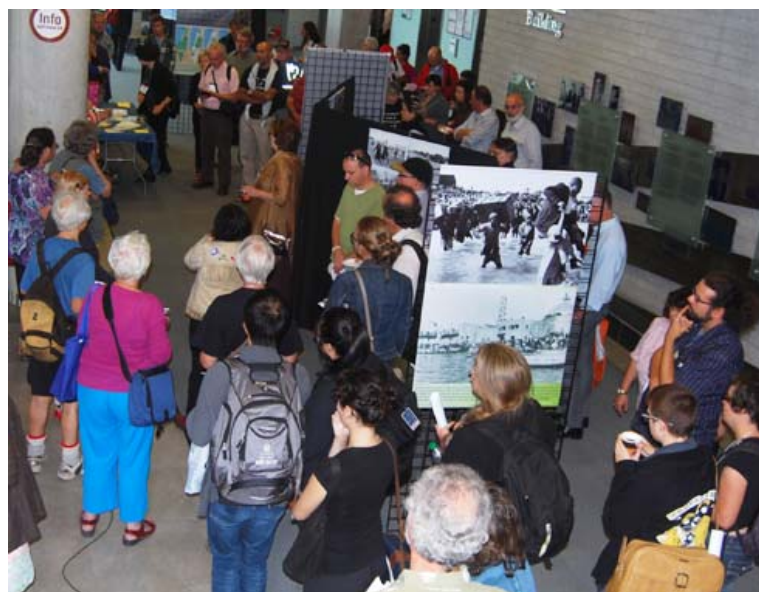
Attendees at the vernissage of "Dispossessed but Defiant", an exhibition linking the common struggles of the First Peoples in Canada; Blacks and the apartheid regime in South Africa; and the occupation of Palestine by Israel. Presented by Canadians for Justice and Peace in the Middle East.