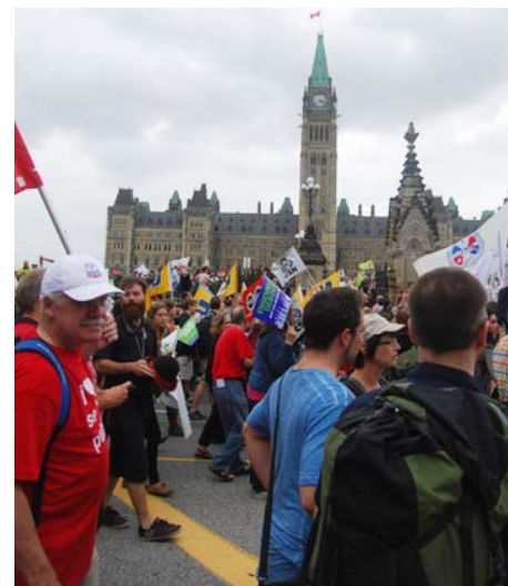
Rassemblement sur la Colline du Parlement, l'après-midi du 21 août

Dans l'ensemble, c'était un rassemblement merveilleux qui a renforcé mon engagement à devenir un meilleur militant pour notre syndicat, notre société et notre planète. J'ai hâte au prochain Forum Social Mondial à Montréal en 2016!