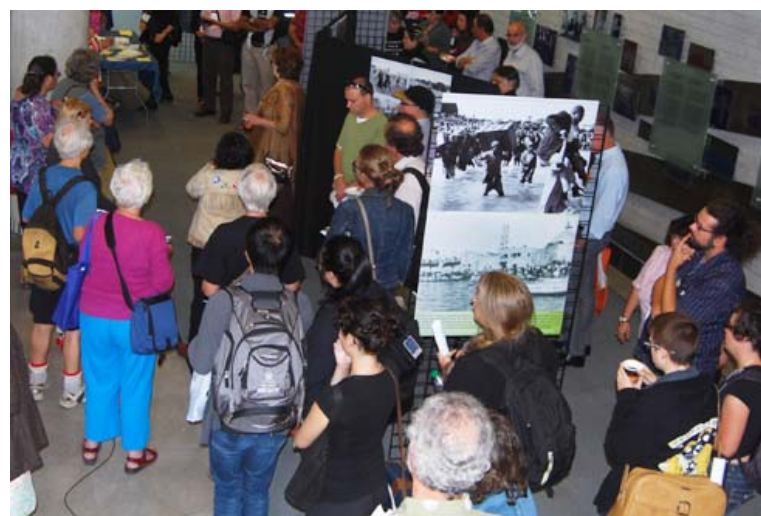
Le public au vernissage de "Dépossédés mais Défiants," une exposition sur les luttes communes des Premières Nations au Canada; des Noirs pendant le régime de l'apartheid en Afrique du Sud; et l'occupation de la Palestine par Israël, exposition présentée par le groupe, Canadiens pour la Justice et la Paix au Moyen-Orient