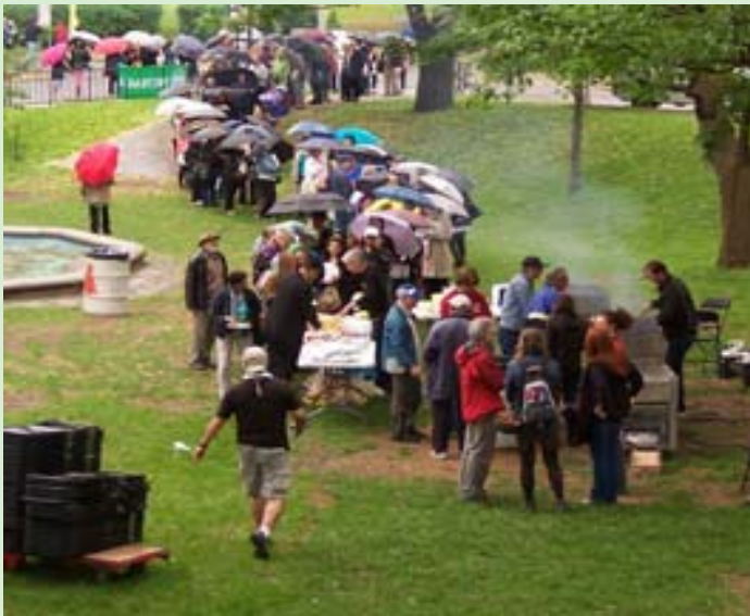
C'est comme "Les Parapluies de Cherbourg..."

Il n'y a que quelques gouttes ! Aguerriés par le piquetage en tous types de météo pendant la grève, les membres de MUNACA ne sont nullement impressionnés par une petite averse. La queue sortait de la Place "Three Bares" - on a profité des hamburgers et des chiens chauds, de la musique de nos musiciens de la ligne de piquetage , bavarder avec nos amis, nos collègues et nos copains de la grève.