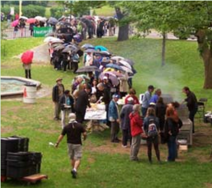
Like the Umbrellas of Cherbourg...

June 6 – Spring BBQ - Rain, what rain? After picketing in all weathers during the strike, MUNACA members weren't fazed by a spring shower. The line snaked out of Three Bares for hamburgers and hot dogs, music from our picket line musicians , chatting with friends, colleagues and picket buddies.